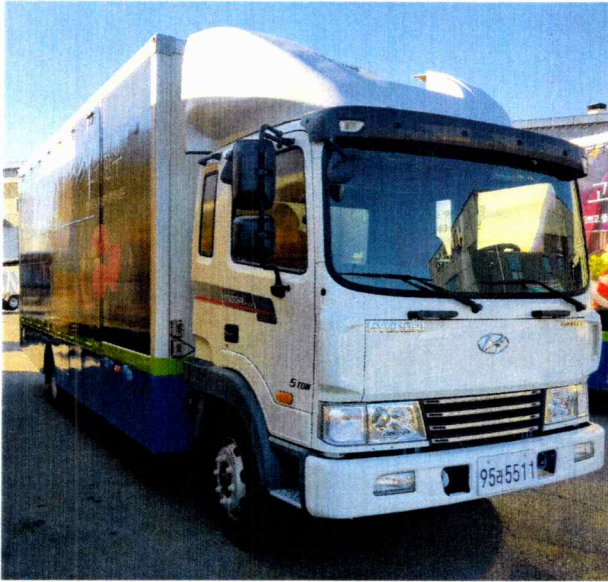
□ 95라5511 이동판매차량 사진(내·외부)